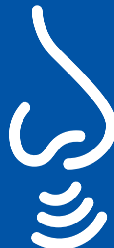
Moeite met asemhaal

Sommige mense kan ook lyfseer, 'n toe neus of loperige neus, 'n seer keel of diarree ervaar.