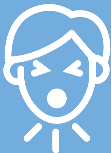
'n Droë hoes